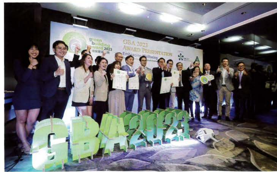
南豐集團憑著AIRSIDE項目獲得「環保建築大獎2023」新建建築類別（已落成項目——商業）大獎。