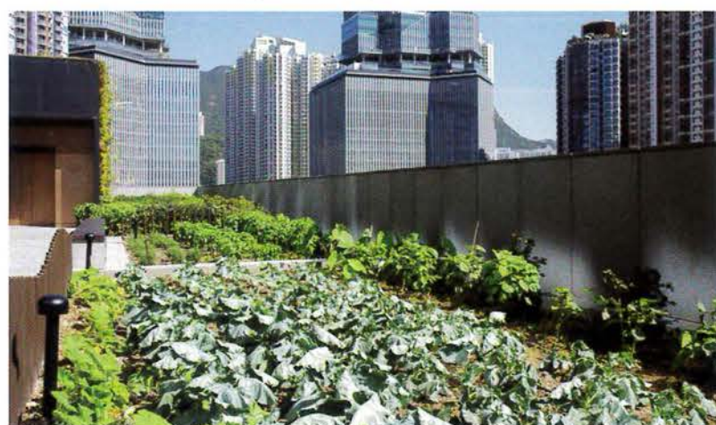
AIRSIDE綠化面積覆蓋整個項目的30%，設有空中花園、露天劇場及都市農莊供公眾及租戶享用。(圖片由被訪者提供)

至於對外方面，南豐集團於2021年推出「世界之約」，這是一個面向公眾的推廣主題，每年各異，今年是全人健康，AIRSIDE舉行運動日，同時加入各種遊戲。