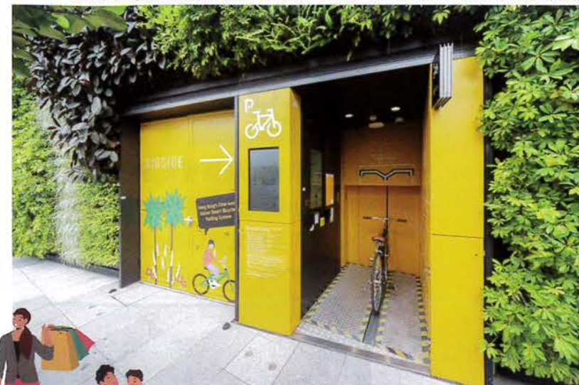
AIRSIDE引入全港首個智能泊單車系統，共提供48個單車泊位。