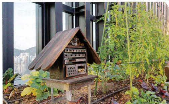
AIRSIDE設有「昆蟲酒店」，讓附近的昆蟲入住。

如果租戶參與AIRSIDE的社區項目，南豐集團協助進行SROI，集團最終希望物色到第三方認證機構，提升SROI機制的公信力。