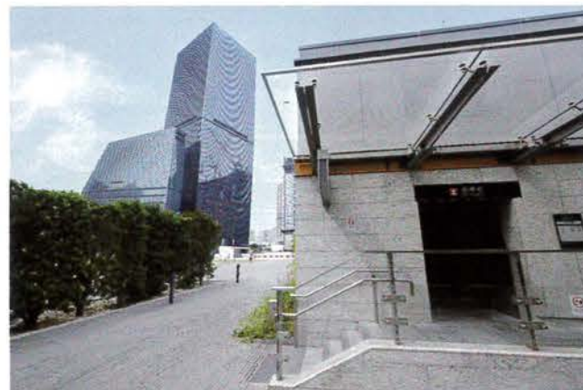
AIRSIDE獲得七大綠色及智能建築證書。

該獎項是業界最高殊榮之一，並被譽為業內的奧斯卡大獎，本屆以「擁抱美好生活·締造優質綠建環境」為主題，提名數目創歷史新高。