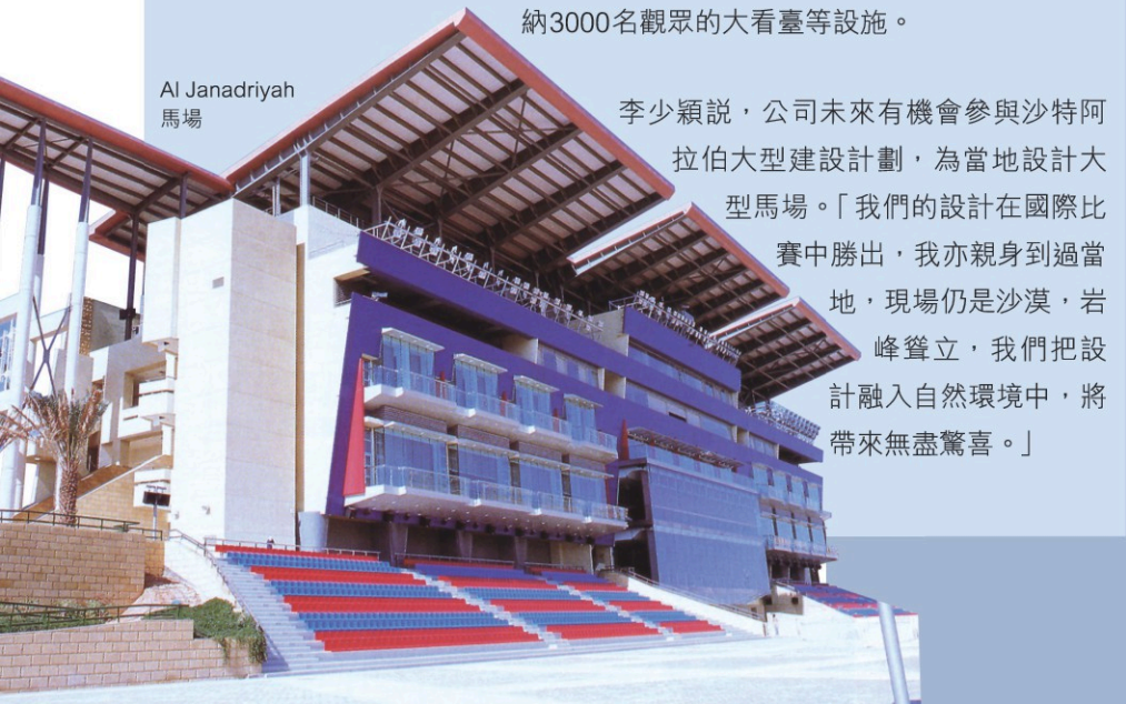
Al Janadriyah 馬場