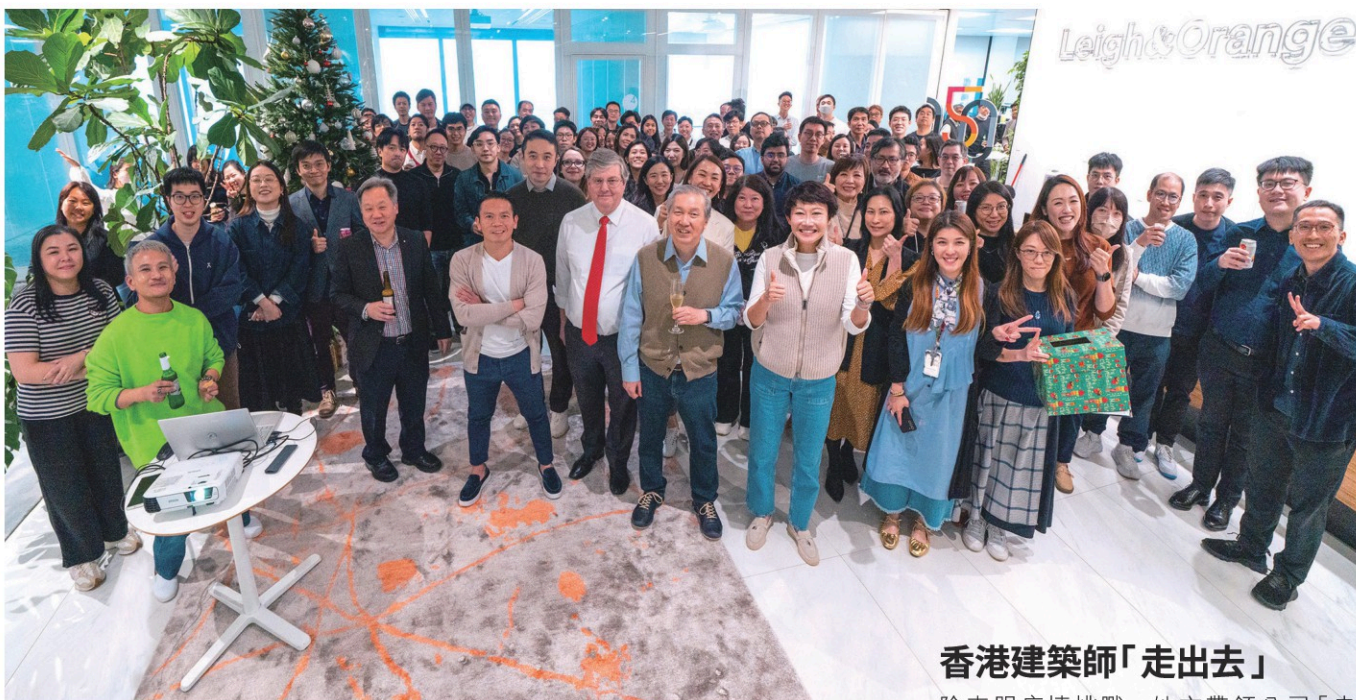
利安團隊舉行節日慶祝活動。