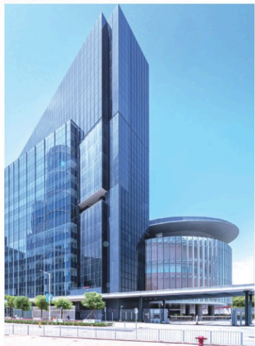
立法會綜合大樓擴建工程